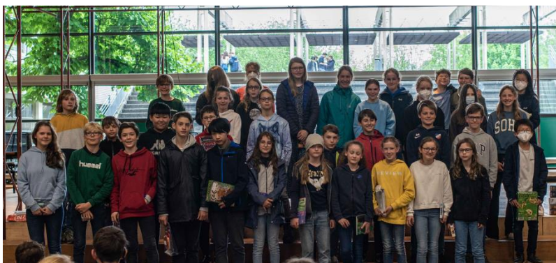
Sieger der Klassenstufen 5/6

Aber beim Känguru geht es nicht nur um die Preise, sondern vor allen Dingen um die Freude an Mathematik und am Knobeln. Daher bekamen alle, die teilgenommen hatten, als Andenken eine Urkunde und ein Baumeisterspiel. So konnten alle weiter knobeln und sich zusätzlich ganz spielerisch mit Mathematik beschäftigen, denn das ist schließlich das Wichtigste bei diesem Wettbewerb: der Spaß am Denken und an der Mathematik. Wir freuen uns schon jetzt auf das nächste Jahr!