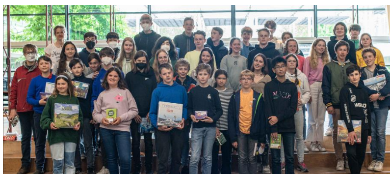
Sieger der Klassenstufen 7-12